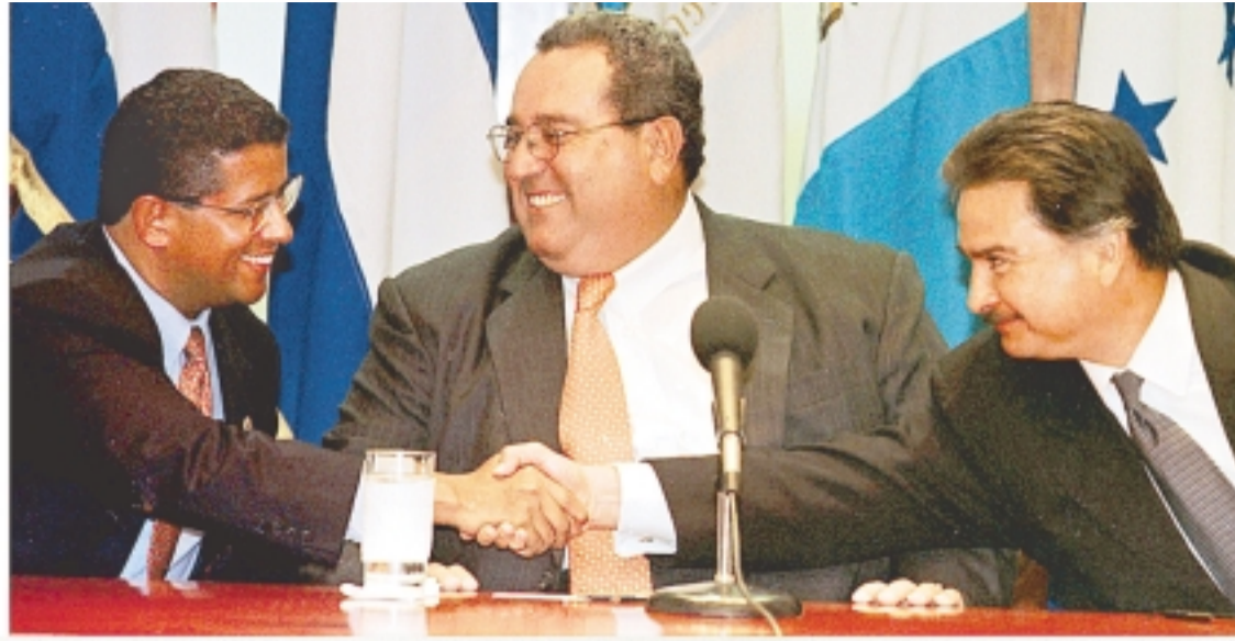
Der an Börse und Bauch gewichtige Präsident Nicaraguas, Arnoldo Alemán (Mitte) mit den Präsidenten El Salvadors (l.) und Guatemalas. Diese Länder bekommen Millionen Dollar Entwicklungshilfe. Doch manche Hilfsprojekte sind für die Bevölkerung kontraproduktiv.

Jahrelange Entwicklungsarbeit fördert bei Dritte-Welt-Ländern die Nehmer-Mentalität. Oft macht die Hilfe mehr kaputt, als sie aufbaut. Wem nützt das Engagement der Industrieländer? Eine Analyse.